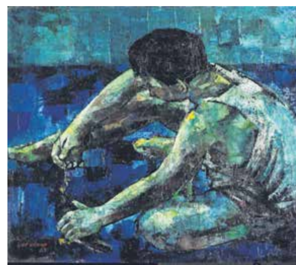
（左）萧学民作于2009年油画《亚罗士打，马来西亚》。