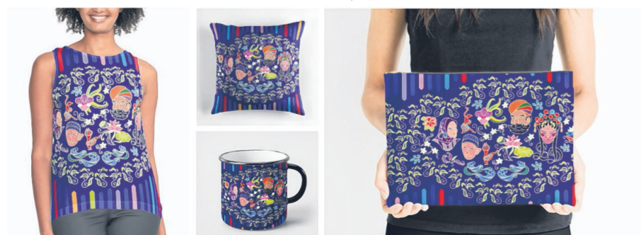
↑ ↓ 花样之都

设计师运用各种耀眼的印花图设计出单肩包、便利贴、笔记本等日常时尚物品，反映出新加坡缤纷灿烂的多元文化。印花图灵感取自美食、建筑、植物和花卉等本土文化的特征。“花样之都”系列在吸引追求时髦的时尚族群消费之余，也潜移默化地增进他们对本地文化的鉴赏。