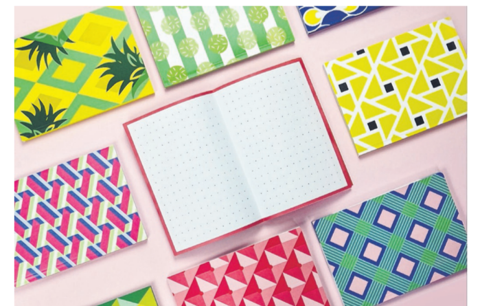
近时异精彩，远时亦如画