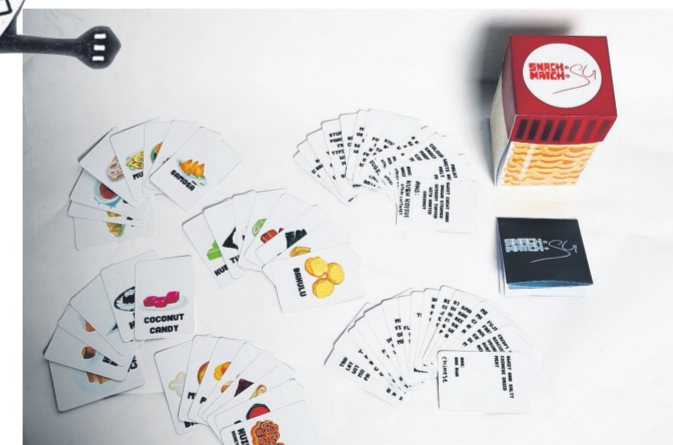
新加坡美食大拼配

作品的主体是“圆”，与“元”谐音，妙趣横生地带出我国社会的多元性，意在各族文化团团圆圆，和谐共处。新加坡多元文化的元素虽在作品中以同样的比重同时出现，却互不冲突，和谐融洽。图中的传统建筑物代表了各族群的精神信仰，各据一方，共存于新加坡这片海纳百川的土地上，提醒着我们多元社会对和平、繁荣与真善美的追求。