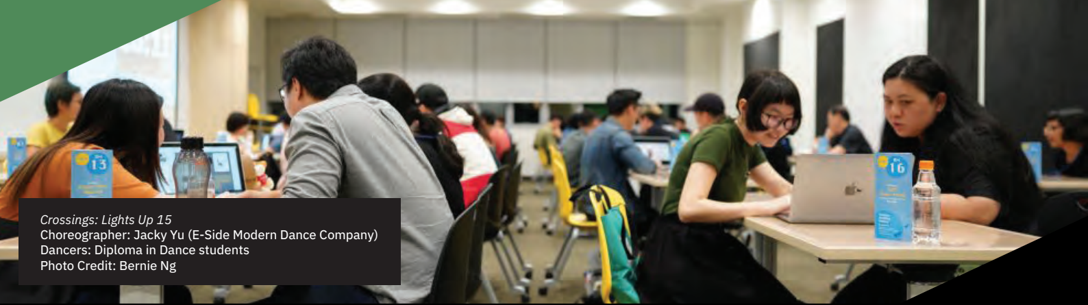
Crossings: Lights Up 15 Choreographer: Jacky Yu (E-Side Modern Dance Company) Dancers: Diploma in Dance students