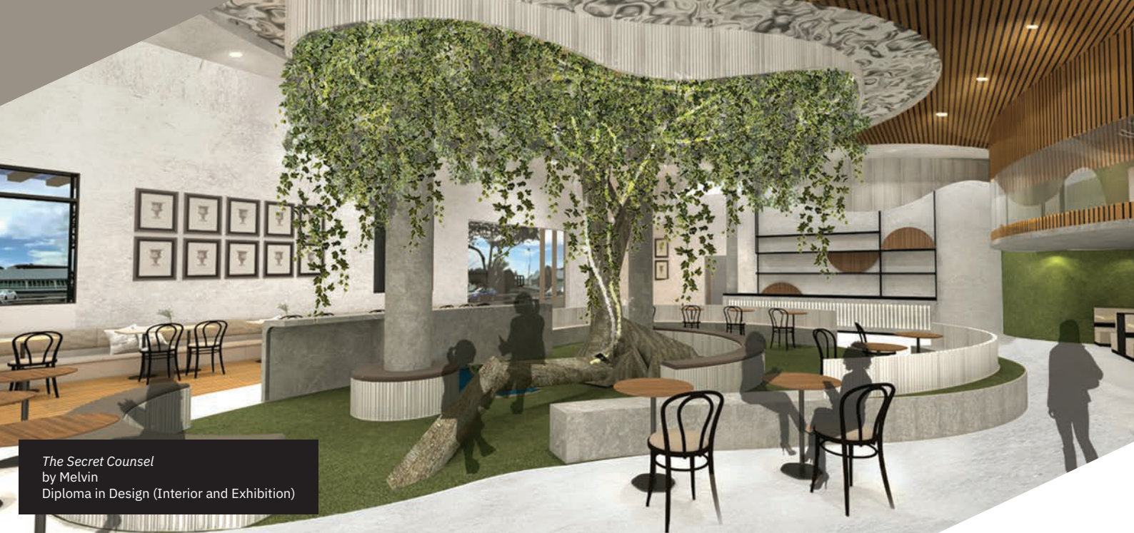
The Secret Counsel by Melvin Diploma in Design (Interior and Exhibition)