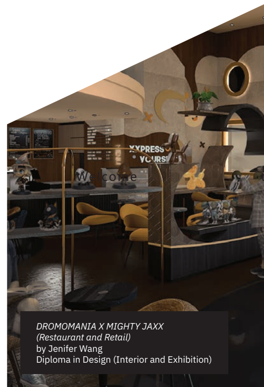
DROMOMANIA X MIGHTY JAXX (Restaurant and Retail) by Jenifer Wang Diploma in Design (Interior and Exhibition)