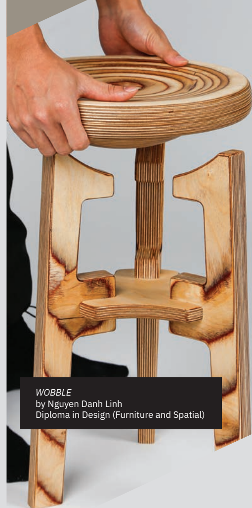
WOBBLE by Nguyen Danh Linh Diploma in Design (Furniture and Spatial)